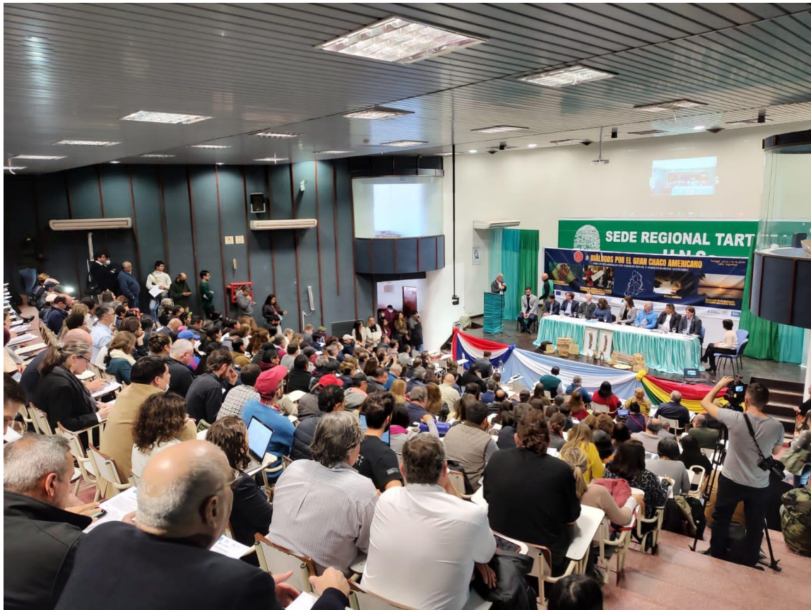
Conférence de chercheurs français et latino-américains pour le Gran Chaco Américain : Pour un développement socialement équitable et écologiquement durable, juin 2022