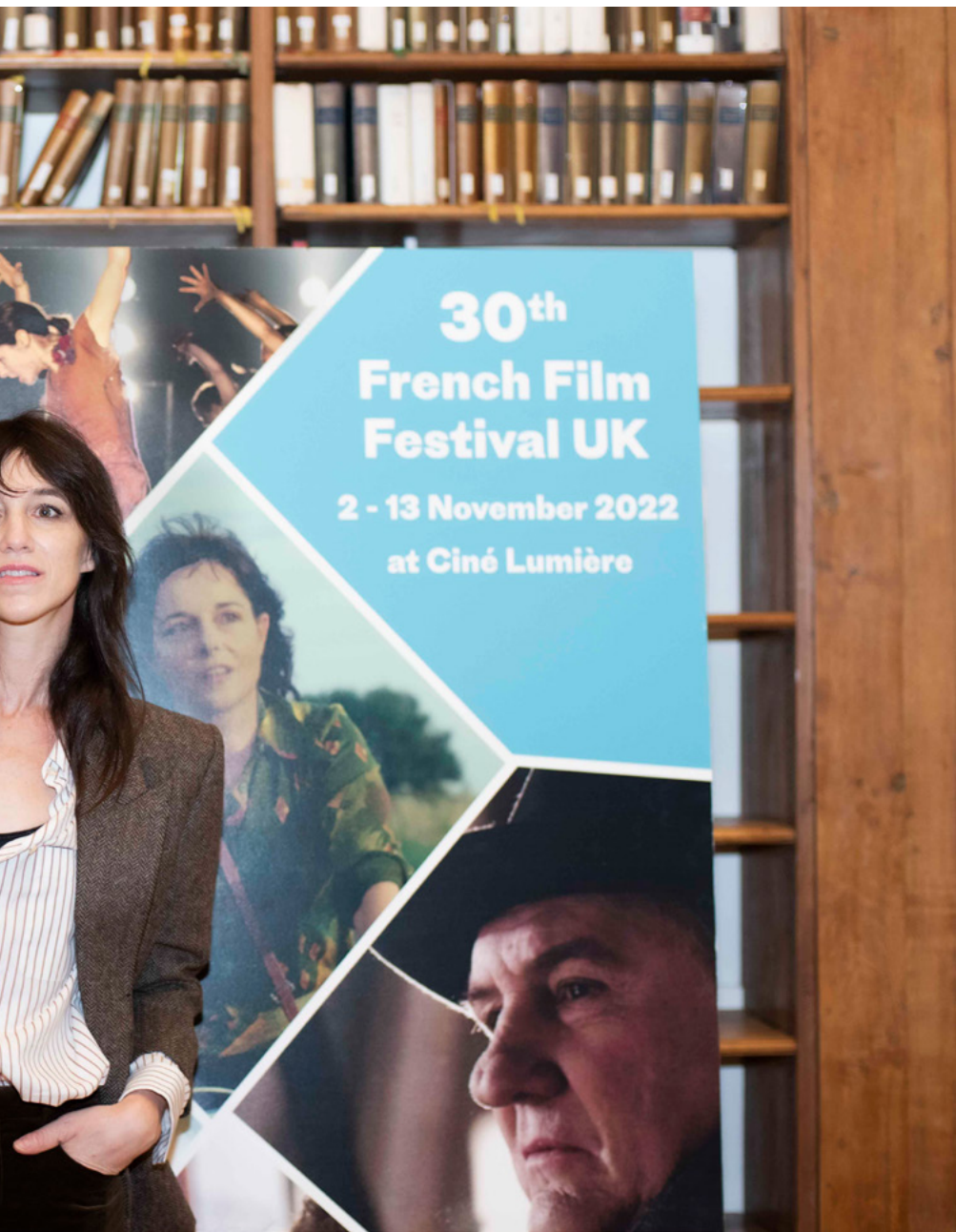
Charlotte Gainsbourg à l'IFRU pour la projection de son film Jane by Charlotte au French Film Festival 2022 © Institut français du Royaume-Uni.