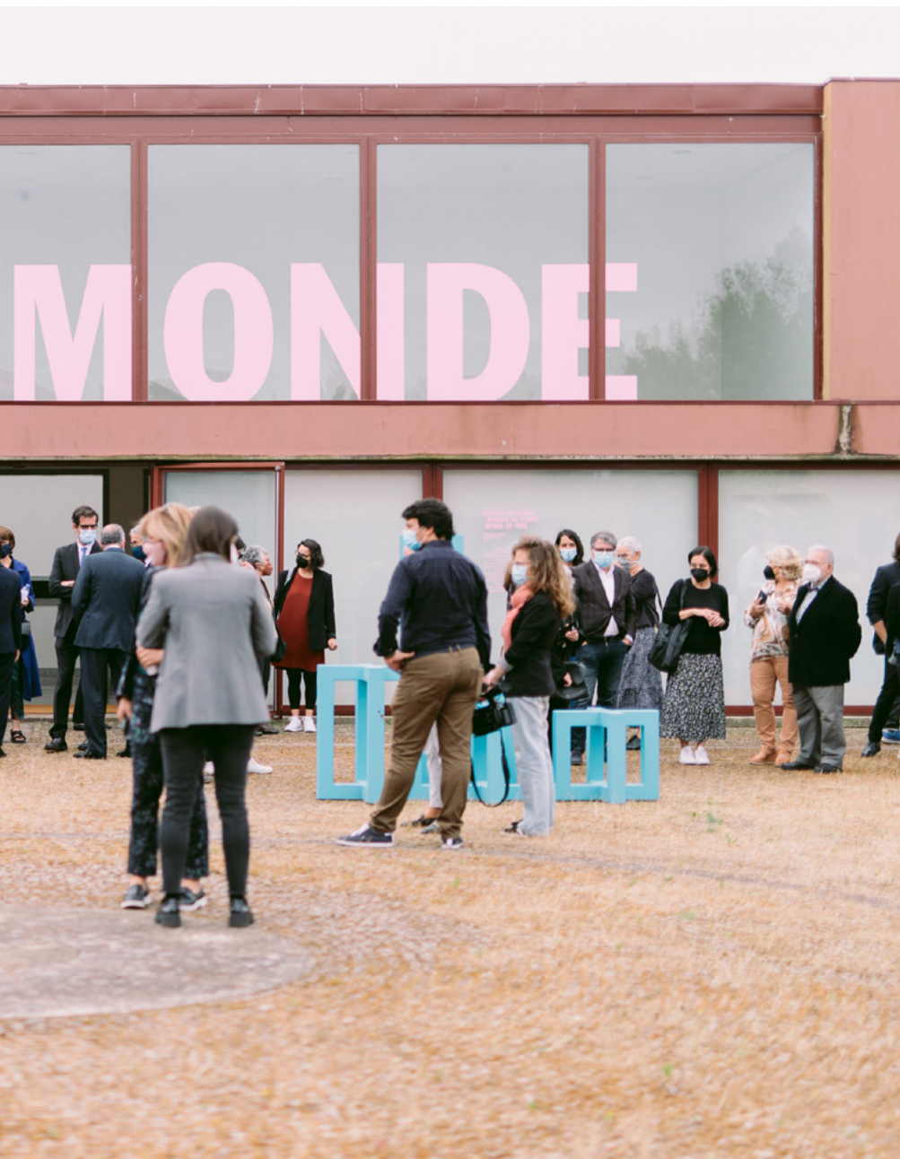
Inauguration de la Biennale