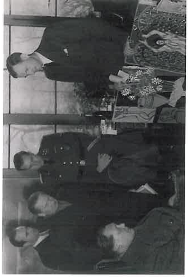
Visite de Göring au Jeu de Paume au début des années 1940

Le site www.civs.gouv.fr décrit précisément les principes et le mode de fonctionnement de cette instance ainsi que les procédures d'indemnisation mises en œuvre par elle.