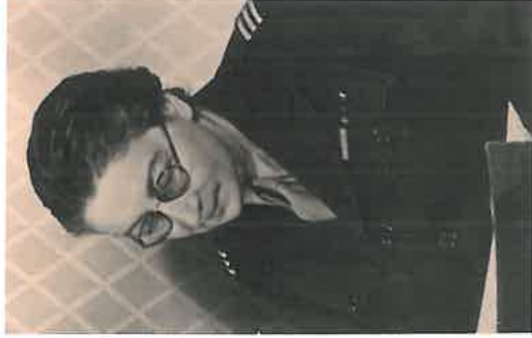
Rosa Valland vers 1947 en Allemagne

www.diplomatie.gouv.fr/fr/sites/archives_diplo/schloss