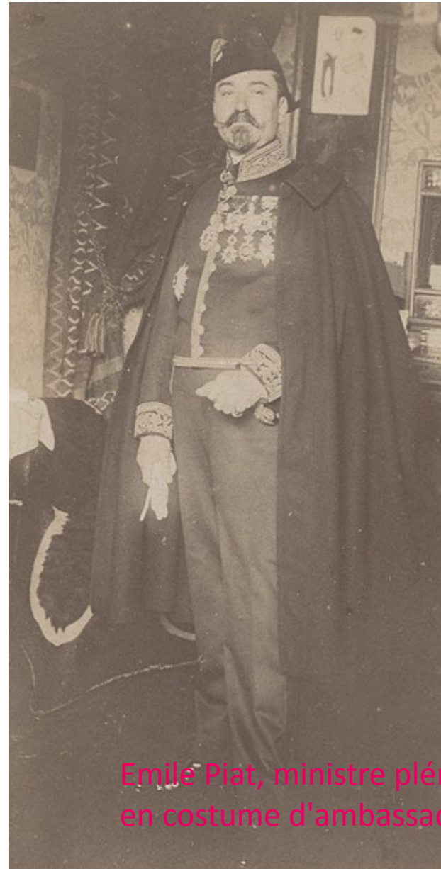
Emile Plat, ministre plénipotentiaire, en costume d'ambassadeur, 1870

Les premières ambassades permanentes sont créées au XVIe siècle